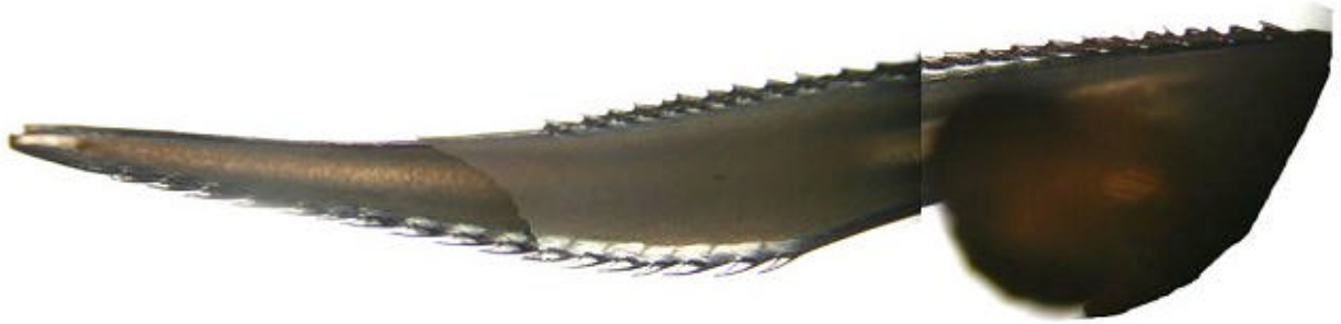
Foto2a: Rostrum Tier DX

Die Rostrumformel lautet 2-3 + 17-20 + 1x / 17x , wobei bei den Tieren DY, DZ die Bezaehlung aufgrund des abgebrochenen Rostrums nicht mehr endgültig geklärt werden konnte.